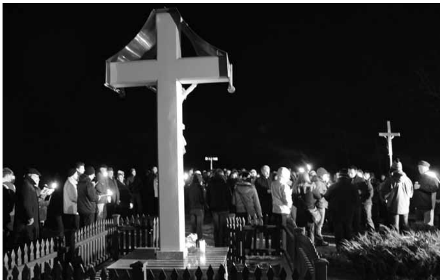
Na kraju mučeniške smrti