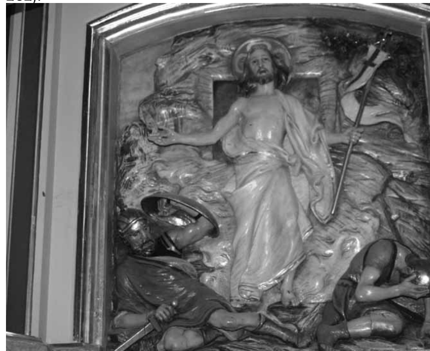
Nagradno vprašanje št. 2: Iz katere župnijske cerkve v soboški škofiji je ta prizor z glavnega oltarja?

Kristjani so imeli do oltarja vedno sveto spoštovanje, saj so vedeli, da predstavlja Kristusa. Vedeli so, da je oltar zakramentalno znamenje; prostor, kjer se srečujeta Bog in človek, čas in večnost; prehod, preko katerega Božje posvečenje prihaja v človekov čas, človekovo življenje, misel, besede in dejavnost pa prehajajo v Božjo večnost.