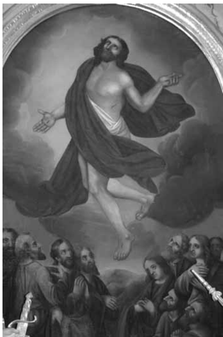
Slika Gospodovega vnebohoda v Bogojini

Pri vnebohodu gre za dovršitev Kristusovega vstajenjskega poveljanja. Praznik nam živo kliče v spomin, da tista Luč, ki je zasijala v velikonočnem jutru, nikdar več ne bo ugasnila. Jezus je »šel v svojo slavo« (Lk 24,26), »in njegovemu kraljestvu ne bo konca« (nicejsko – carigrajska veroizpoved). Slava, ki jo je Kristus dosegel, je tudi naša slava. Nebesa so prostor v Božjem veličastvu, pripravljen tudi za nas (prim. Jn 14,3).