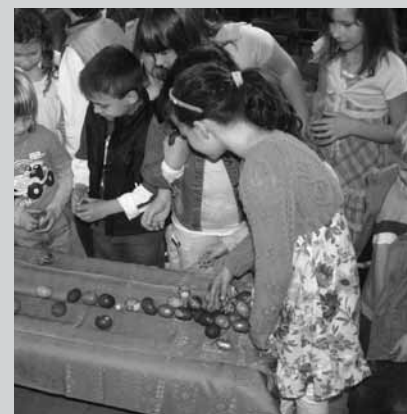
Slika na naslovnici

Praznik življenja, praznik Življenja. Smrt je premagana. Jezus Kristus je vstal od mrtvih in živi. Velika noč nas druži, nas opogumlja, nam dviga pogled. Blagoslovljena jedila so znamenje Jezusovega prehoda iz smrti v življenje. Pa tudi našega prehoda. Pirhi, remenice, remenke so majhne umetnine. Predvsem pa so znamenja novega življenja, ki ga je Kristus zagotovil vsem ljudem s svojo smrtjo in vstajenjem. Kristus je vstal! Aleluja!