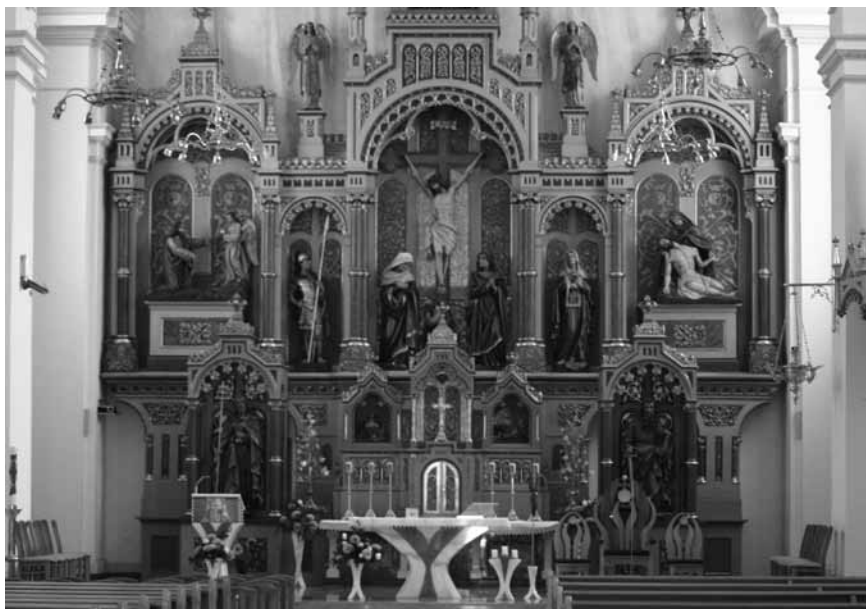
Oltar v župnijski cerkvi v Črensovcih

»Oltar, na katerem postane pod zakramentalnimi znamenji navzoča daritev na križu, je obenem Gospodova miza, ob kateri se Božje ljudstvo zbira, da bi je bilo deležno; oltar je tudi središče zahvaljevanja, ki se opravlja po evharistiji.« Tako je glede oltarja zapisano v uvodu v Rimski misal - mašno knjigo.