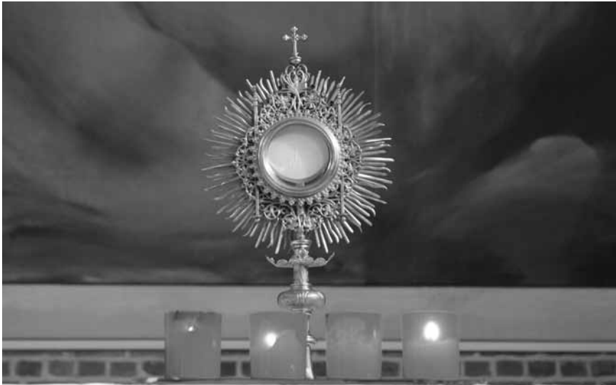
Hvaljeno in češćeno naj vedno bo presveto Rešnje telo

V vsaki župniji so različne dejavnosti in aktivnosti, ki nam pomagajo poglobiti naše spoznanje in vero v Jezusovo navzočnost. Radi se vključimo. K spoznavanju Jezusa nam pripomore tudi redno branje Svetega pisma, verskega tiska (vsak kristjan naj redno bere verski časopis npr. Družino ali Ognjišče) in drugih knjig, ki govorijo o sv. maši (npr. Mašna daritev, Evharistični čudeži...). Največ bomo pridobili z rednim obiskom sv. maše (tudi med tednom). Ko gremo mimo cerkve, počastimo Jezusa tako, da se pokrižamo in rečemo: »Hvaljeno in češćeno naj vedno bo presveto Rešnje telo. Zdaj in vekomaj. Amen«. Če se le da, večkrat obiščimo Jezusa v cerkvi, še posebej, ko je skupno češćenje Najsvetejšega. Ni potrebno veliko govoriti, ampak biti prisoten. K sv. obhajilu pridimo zares pripravljeni in ga spoštljivo sprejemajmo. Zavedajmo se Jezusovih besed: »Kdor jé ta kruh, bo živel vekomaj!« (Jn 6,58) ali: »Jaz sem kruh življenja. Kdor pride k meni, gotovo ne bo lačen, in kdor vame veruje, gotovo nikoli ne bo žejen« (Jn 6,35). Radi tudi doma molimo molitev kot pripravo na evharistični kongres (ob tem lahko tudi prižgemo svečo z evharističnim simbolom). K pripravi na evharistič-