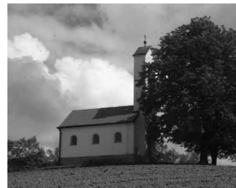
Poznaš lepote naše domovine?