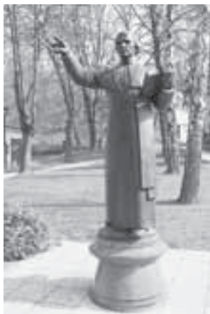
Kip bl. Slomška v Lendavi

Tako ga od 19. septembra 1999 kličemo v svojih molitvah in med vzkliki litanij vseh svetnikov. Zakaj?