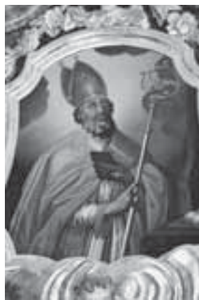
Podoba sv. Nikolaja v dolenski cerkvi

Nikolaj je postal eden najbolj čiščenih svetnikov v vzhodni Cerkvi, najprej v Grčiji in nato v Rusiji, ki si ga je izbrala za narodnega zavetnika. Ruski carji in veliki knezi so nosili njegovo ime