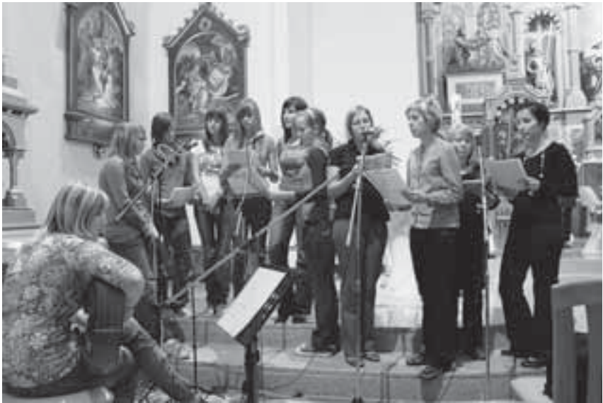
Dekliški zbor iz Bistic poje na Halasovem shodu v Črensovcih

Božji služabnik Danijel Halas povzdignjen na oltar. Na srca so zapisali mnoge dejavnosti od vsakodnevne molitve, molitve križevega pota, romanj, do raznih razstav, katehez, Power Point projekcij, oratorija, romarskih shodov, spominskih parkov, postavitve raznih obeležij. S tem so pokazali, kako živo je med verniki prisotna zavest, da je Danijel Halas zares sveto živel in umrl mučeniške smrti. Iz teh pričevanj je vela tudi goreča prošnja, da bi Cerkev čim prej potrdila, da je Danijel Halas deležen nebeške slave. Po sveti maši je sledil kratek kulturni program, v katerem sta recitatorja spomnila na nekatere trenutke Halasovega življenja, s pesmijo pa so sodelovali trije domači pevski zbori otroški, dekliški in odrasli mešani zbor.