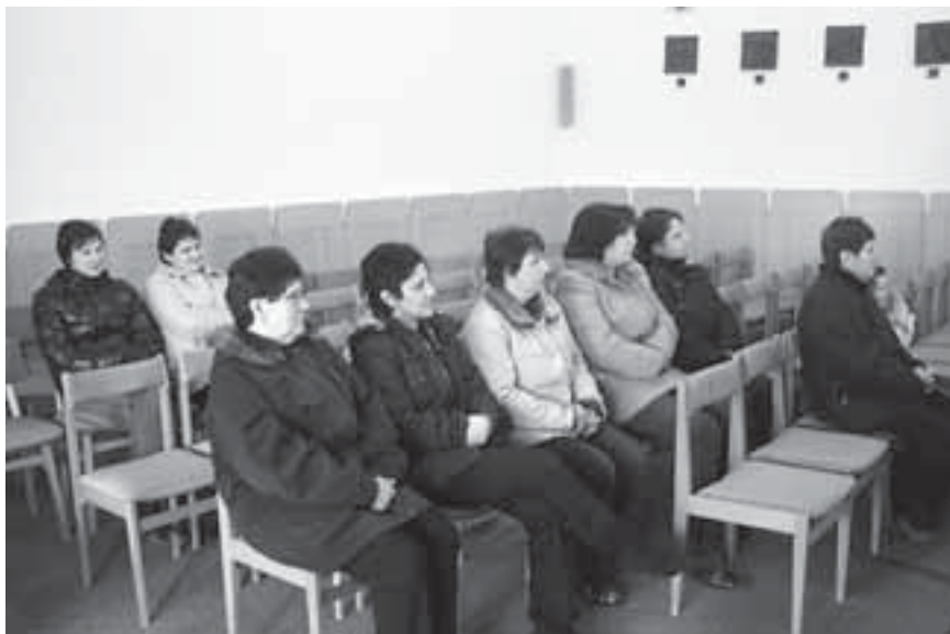
Biti ob delavnikih pri sveti maši je blagoslov

Ob vseh teh dejstvih, o katerih smo razmišljali, lahko torej vsaj malo začutimo smisel in pomen delavniških maš ter udeležbe pri njih. Razumljivo je, da vsi verniki nimajo priložnosti in možnosti, da bi se vsak dan udeležili sv. maše. Kdor pa more, pa je k temu lepo povabljen. Morda je prav leto evharistije, ki se začena, lepa priložnost, da bi se pri vernikih poživila udeležba