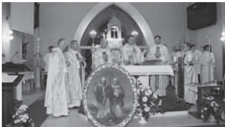
Ob prazniku sv. Metoda